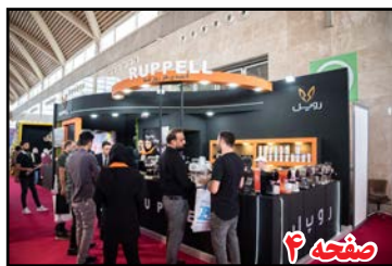
تجربه حضور در شهر آفتاب از نگاه غرفه داران