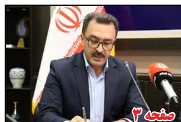
نمایشگاه شهر آفتاب، فضای استاندارد برای برگزاری نمایشگاه های مختلف دارد