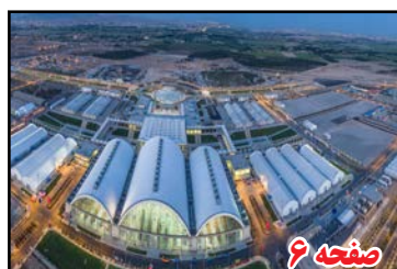
مزیت های راهبردی نمایشگاه بین المللی شهر آفتاب