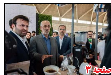
مسئولان موظفند از برگزاری نمایشگاه ها در شهر آفتاب حمایت کنند